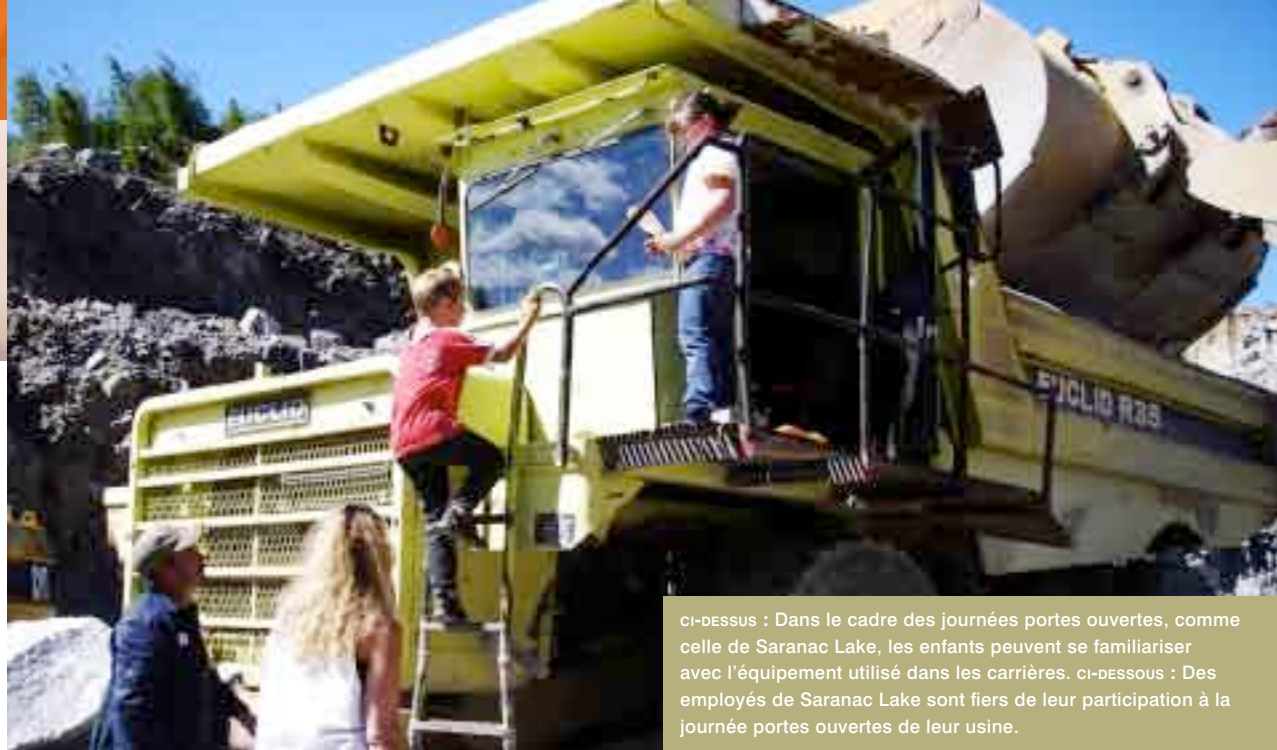
CI-DESSUS : Dans le cadre des journées portes ouvertes, comme celle de Saranac Lake, les enfants peuvent se familiariser avec l'équipement utilisé dans les carrières. CI-DESSOUS : Des employés de Saranac Lake sont fiers de leur participation à la journée portes ouvertes de leur usine.

À Faulkner, par exemple, notre usine a déployé des efforts extraordinaires pour convaincre des membres de la profession médicale de rester dans la communauté. La pénurie de médecins était si criante que l'hôpital a même dû fermer temporairement ses portes, y compris l'urgence. Des employés de Graymont